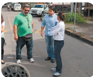
"Força Tarefa" já conseguiu reduzir lançamento de esgoto.