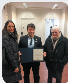
Com os organizadores do Seminário.

Caiado esteve em seis estados americanos, onde teve a oportunidade de ampliar seus conhecimentos. Lá acompanhou um pouco das primárias das eleições presidenciais em alguns estados americanos, visitou comitês de campanhas, prefeituras e outros órgãos públicos. Teve palestras com diversos especialistas na área de ciência política, marketing político, administração pública, entre outros temas.