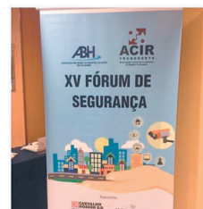
A central vai atuar de forma preventiva, com monitoramento em tempo real.