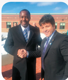
Com o candidato Dr. Ben Carson.