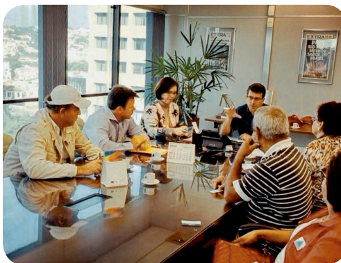
Parlamentares levam demandas da região ao Secretário de Saúde.