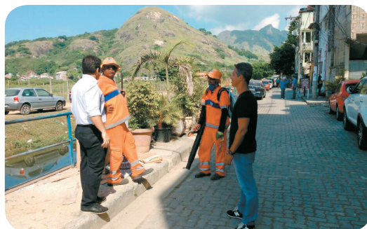
Comissão de Saneamento acompanha ação da Comlurb.

V inculada à "Força Tarefa", a Comlurb realizou um mutirão de limpeza e conscientização ambiental nas margens e nas ruas do entorno do Canal das Taxas. A ação de abordagem dos profissionais da Comlurb contou com a distribuição de novos contêineres de lixo e a distribuição de informativos, com o objetivo de conscientização sobre preservação do