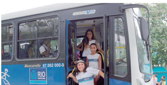
Transporte para alunos reduziu evasão escolar