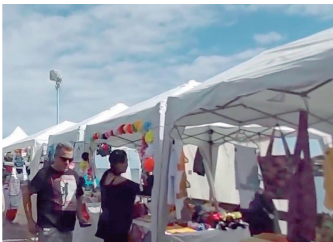
Feira de artesanato atrai frequentadores do mundo todo