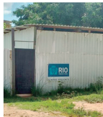
Moradores aguardam retomada da obra

“Existe um deficit de vagas para novos alunos nas escolas municipais em Guaratiba. Há enorme expectativa dos pais de alunos, que aguardam ansiosos pela inauguração desta nova unidade escolar”, ressaltou Caiado.