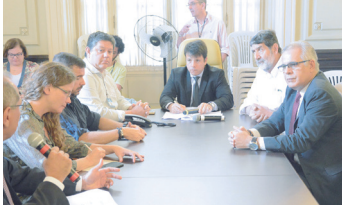
Audiência na Câmara