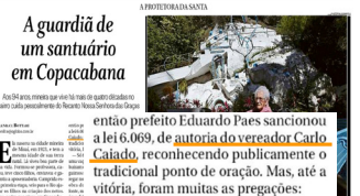
Aguardiã de um santuário em Copacabana A guardiã de um santuário em Copacabana.

Cidade do Rio de Janeiro, através da Lei Municipal nº 6069/2016, de autoria do Vereador Carlo Caiado.