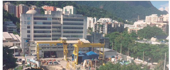
Conclusão das obras deveria ser em 2018

na implantação do trecho entre Ipanema e Barra. Recentemente, o próprio TCE derrubou a liminar, permitindo a continuidade da obra.