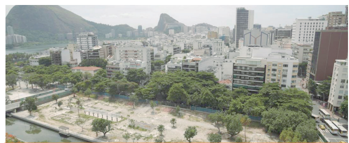
Área está desvitalizada

Governo do Estado e da Concessionária que construiu a nova linha metroviária, de promover a reconstrução dos locais onde foram instalados os canteiros de obra, um deles justamente na praça do Jardim de Alah, que deve ser devolvido à população da forma como foi entregue”, destacou Caiado.