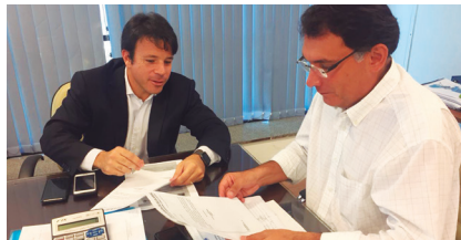
Caiado em reunião na Secretaria Municipal de Saúde