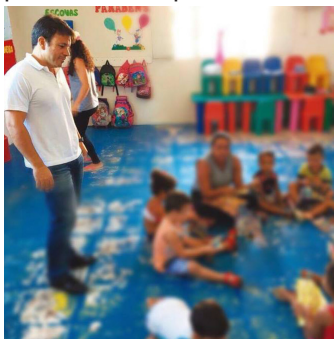
Caiado em visita a uma das creches da Prefeitura

É fundamental garantir uma educação de qualidade com infraestrutura adequada para alunos e professores. Conheça as lutas de Caiado para a Educação: