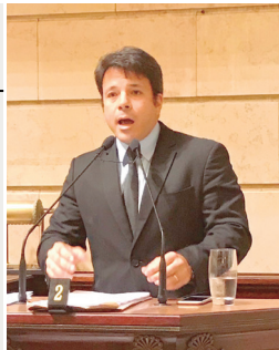
Voto em defesa da população