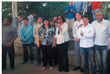
Acompanhando a visita do Prefeito às escolas de Guaratiba